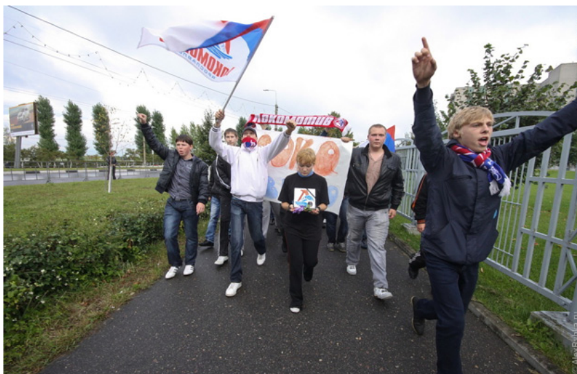
Рисунок 2. Шествие фанатов к стадиону ХК «Локомотив».

15. Черные ленты на заборе вокруг стадиона.